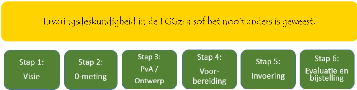
Figuur 3: Een goed project als basis

patiënten en medewerkers om dit voor elkaar te krijgen. Ervaringsdeskundigheid in de FGGZ alsof het nooit anders is geweest.