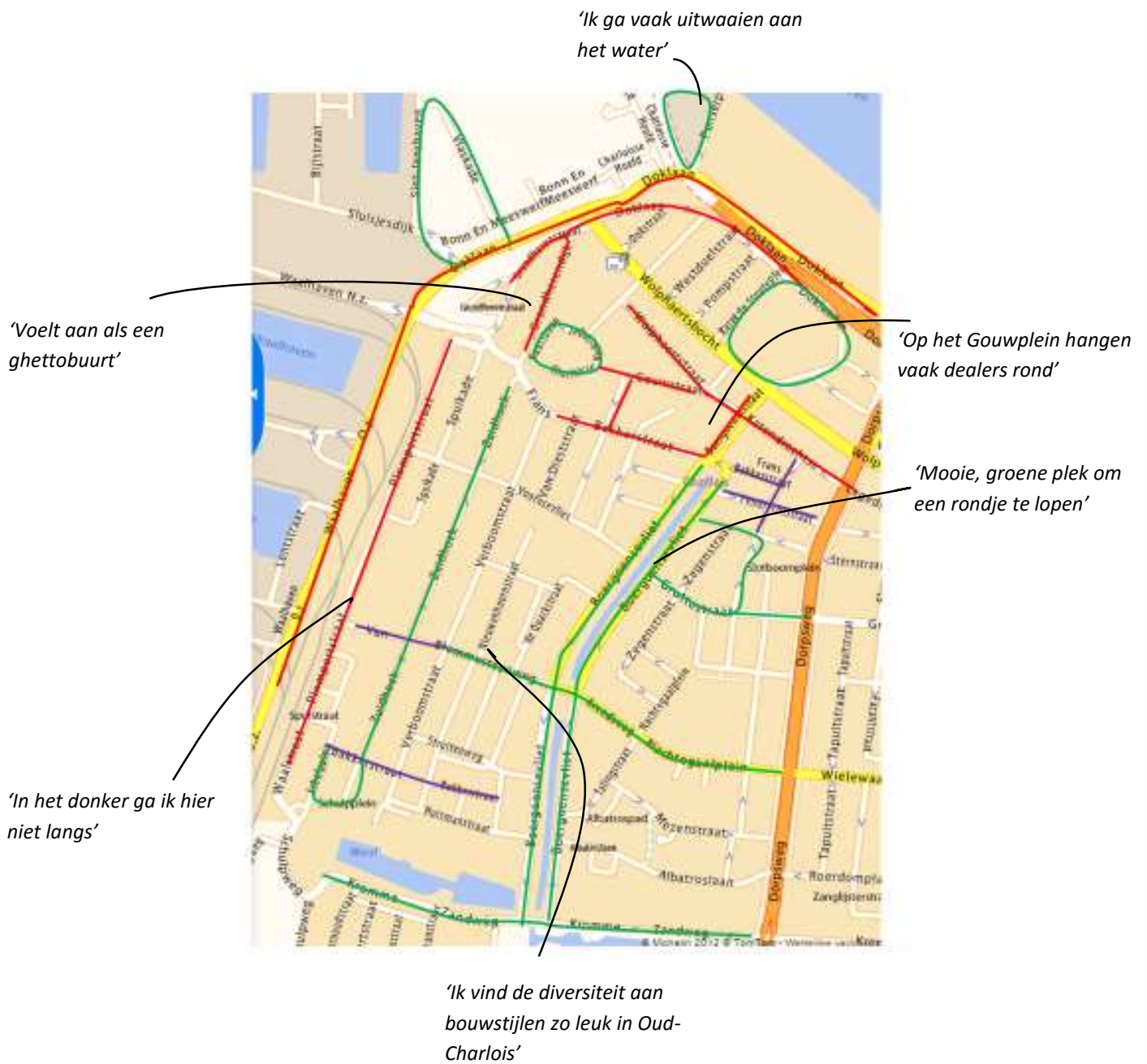
Figuur 1. Oud-Charlois met haar prettige en minder prettige straten

In figuur 2 is de plattegrond van Spangen te zien, met daarop de prettige straten (groen) en minder prettige straten (rood) gemarkeerd. De paarse straten zijn door een enkeling aangegeven als minder prettig.