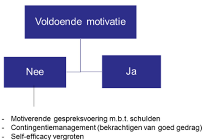
Figuur 1: Beslisboom motivatie

Bij een ‘ja’ op voldoende motivatie is op dat gebied geen actie vereist, en is de volgende stap te kijken of de cliënt voldoende vaardigheden heeft.