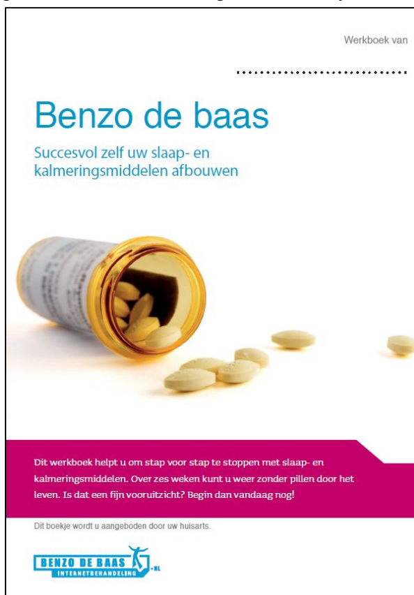
Figuur 3. Voorblad Voorlichtings- en werkboekje

Het voorlichtings- en werkboekje is een belangrijk onderdeel van de interventie. Het voorlichtings- en werkboekje, getiteld: “Benzo de baas. Succesvol zelf uw slaap- en kalmeringsmiddelen afbouwen”, is speciaal voor dit project ontwikkeld door Tactus verslavingszorg (zie Figuur 3). Het is geschreven voor patiënten die er zelfstandig of samen met de POH-GGZ mee aan de slag kunnen.