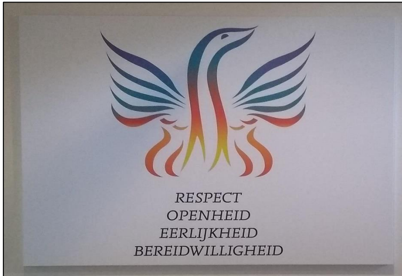
Afbeelding 1: Vier centrale waarden van de YWCC aanpak

holding environment 9 of een veilig en positief klimaat is een van de belangrijkste onderdelen van de aanpak.